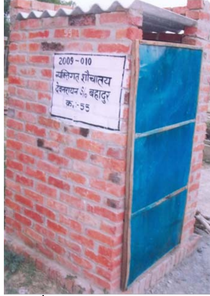
12. देवनरायन S/O बहादुर