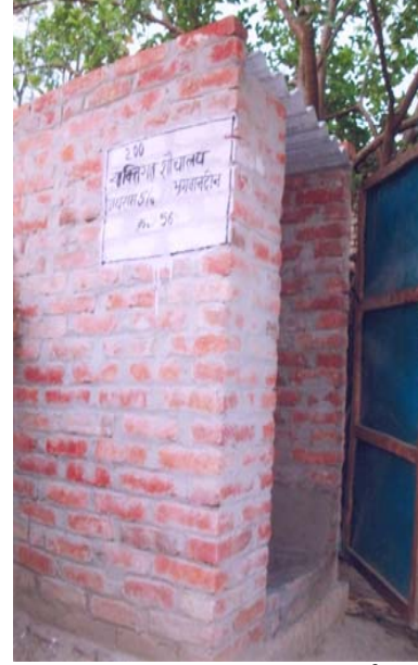
13. जयराम S/O भगवानदीन