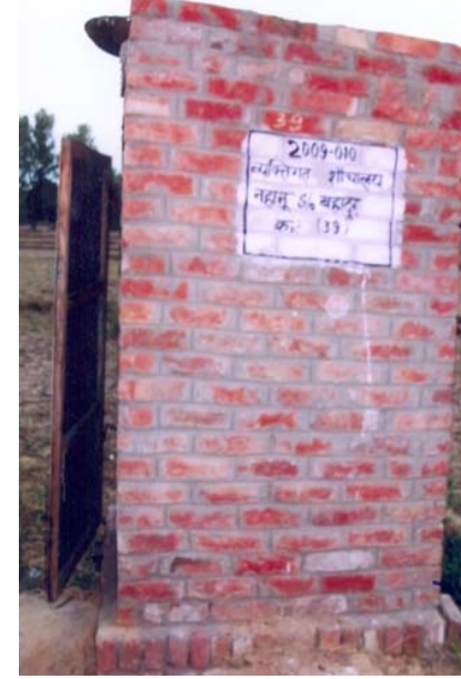
14. नहानू S/O बहादुर