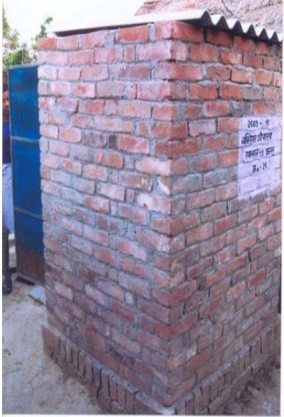
16. रामलाल S/O कल्लू