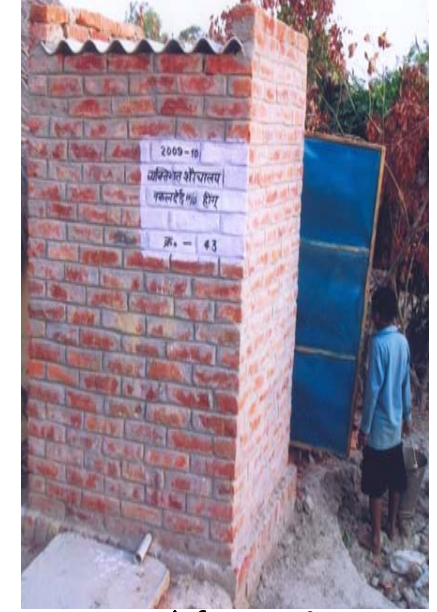
15. नकलदेई S/O हींगू