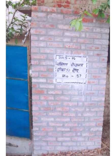
10. द्वारिका S/O हींगू