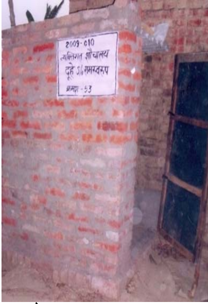
1. दूहे S/O रामस्वरूप