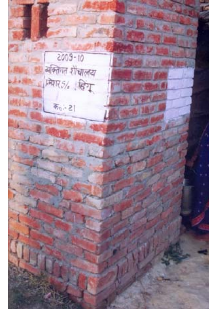
8. परमेश्वर S/O हींगू