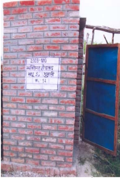
11. साधू S/O भुखाली